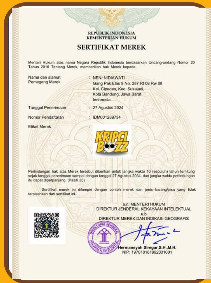
HAKI (On Progress)